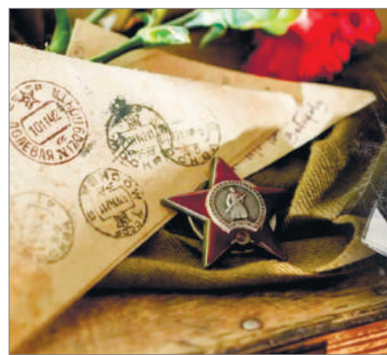
МАЙДАНДА ХАТ ТАСЫҒАН