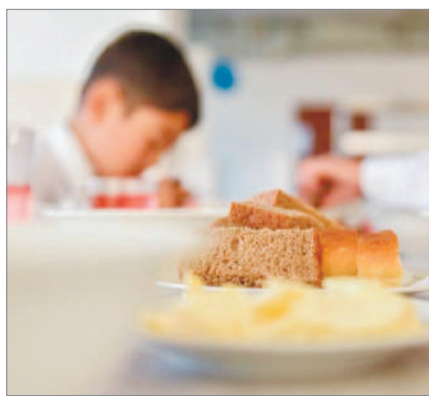
МЕКТЕП МӘЗІРІНЕ МӘН БЕРІЛСЕ...