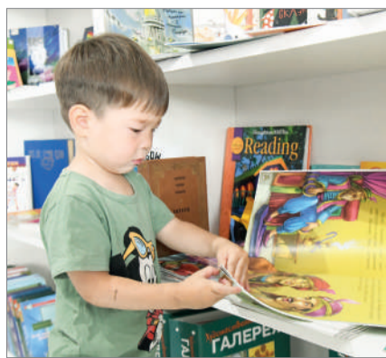
БАЛАНЫ ҚАЛАЙ ҚЫЗЫҚТЫРАМЫЗ?