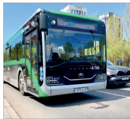
ЖОЛАУШЫЛАР СЕНІМІН АҚТАҒАН