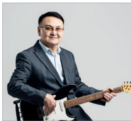
РУХТЫ ӘНМЕН ТЕРБЕГЕН